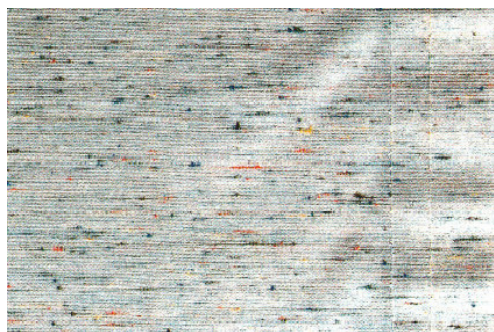
Beispiel Welligkeit im Nahtbereich Exemple ondulation dans les zones des coutures Esempio ondulazioni presso la cucitura