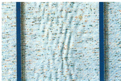
Beispiel Welligkeit im Bahnenbereich Exemple ondulation dans les zones des bords de lés Esempio ondulazioni sulla banda